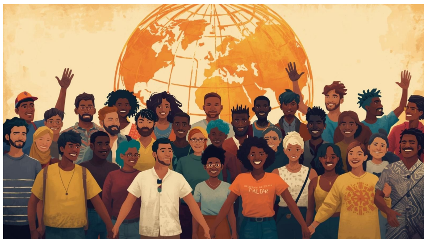
Image créée avec l'IA (Canva)

Le principe de subsidiarité affirme que chaque problème doit être traité au plus près des personnes concernées. L'option préférentielle pour les pauvres s'appuie sur les Béatitudes: « Heureux vous les pauvres, le Royaume de Dieu est à vous » (Luc 6, 20).